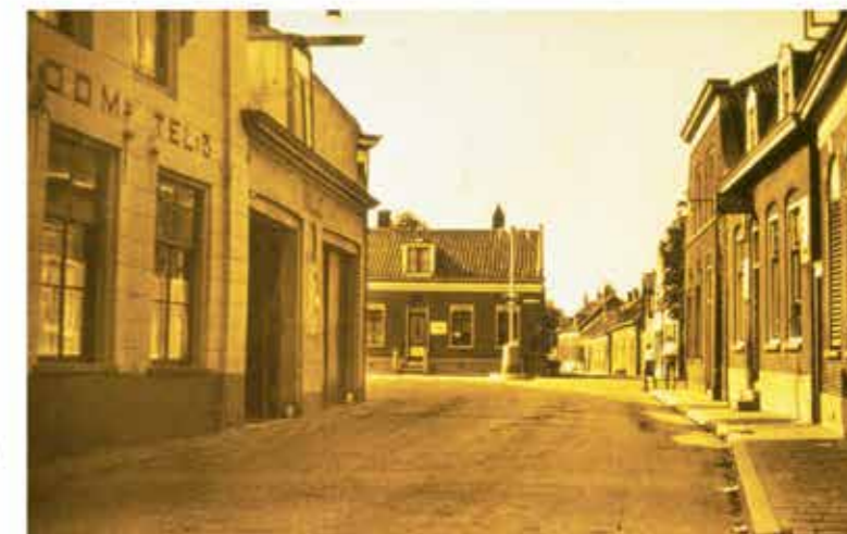
Het pakhuis aan de Dorpstraat in Bergschenhoek is het laatste pand links, met de grote open poort, en zou tot 1962 dienstdoen.