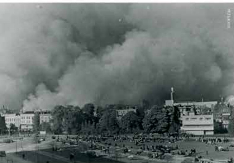
Mensen verzamelen zich op het 'Land van Hoboken' terwijl Rotterdam brandt.