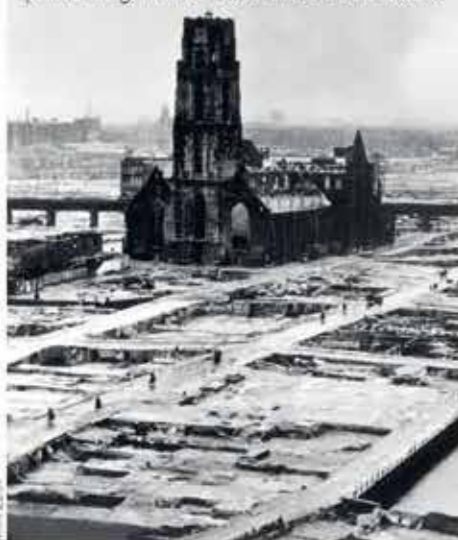
Rotterdam na het bombardement (en puinruiming) met de ruïne van de Laurenskerk.