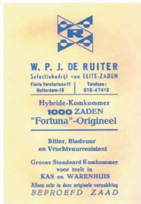
Een van de eerste zaadzakjes van W.P.J. de Ruiter Zaadhandel.